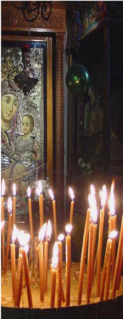
Kerzenschein in der Geburtsstube in Bethlehem