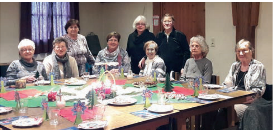
Unsere Seniorengruppe „Mittwochstreff in Etting“