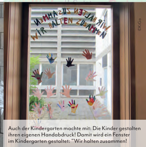
Auch der Kindergarten machte mit: Die Kinder gestalten ihren eigenen Handabdruck! Damit wird ein Fenster im Kindergarten gestaltet: "Wir halten zusammen!"