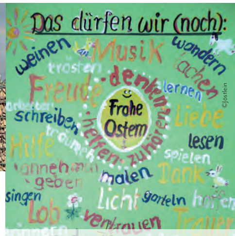
Ein Gemeindeglied gestaltete ein buntes Plakat, das zeigt, was trotz Ausgangs- und Kontaktbeschränkung alles nicht abgesagt und weiterhin möglich war.

Diakonin Maythe Binder hat es in ihrem Editorial erwähnt: wir haben in der Zeit, als alle zuhause bleiben sollten, Hoffnungsbilder gesammelt. Einige davon teilen wir mit Ihnen hier im Paulusbrief. Wenn auch Sie Hoffnungsbilder mit anderen teilen möchten, schicken Sie sie per Mail an christoph.schuermann@elkb.de . Wir veröffentlichen sie dann auf unserer Homepage.