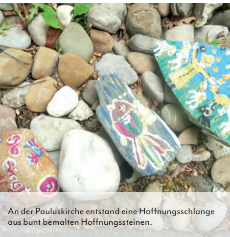
An der Pauluskirche entstand eine Hoffnungsschlange aus bunt bemalten Hoffnungssteinen.