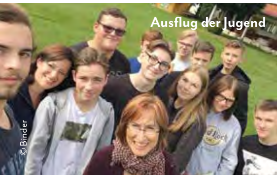
Ausflug der Jugend

Am Samstag, 19. Oktober, von 19.30 Uhr bis Mitternacht in der Dietrich-Bonhoeffer-Kirche in Kösching: Spielen in netter Runde, altbewährte und neue Spiele. Eintritt frei, Snacks und Getränke zu kleinen Preisen.