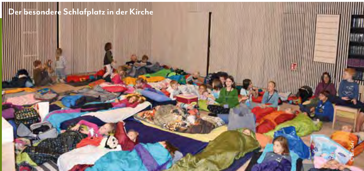
Der besondere Schlafplatz in der Kirche

Ende: Sonntag, 27. Oktober um ca. 11.30 Uhr (nach einem gemeinsamen Gottesdienst)