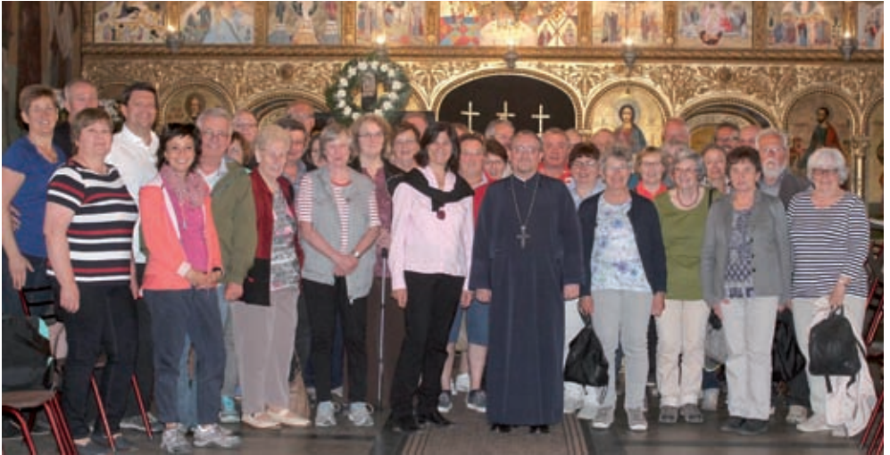
Teilnehmerinnen und Teilnehmer der gemeinsamen Gemeindefahrt von Gaimersheim und St. Johannes nach Siebenbürgen.

Auch dieses Jahr bereiten die Jugendlichen unserer Gemeinde einen Gottesdienst vor. Diesmal lautet das Motto „Auszeit“. Sie sind herzlich eingeladen, am 21. Juli um 10.30 Uhr in der Jakobuskirche in Wettstetten mitzufeiern.