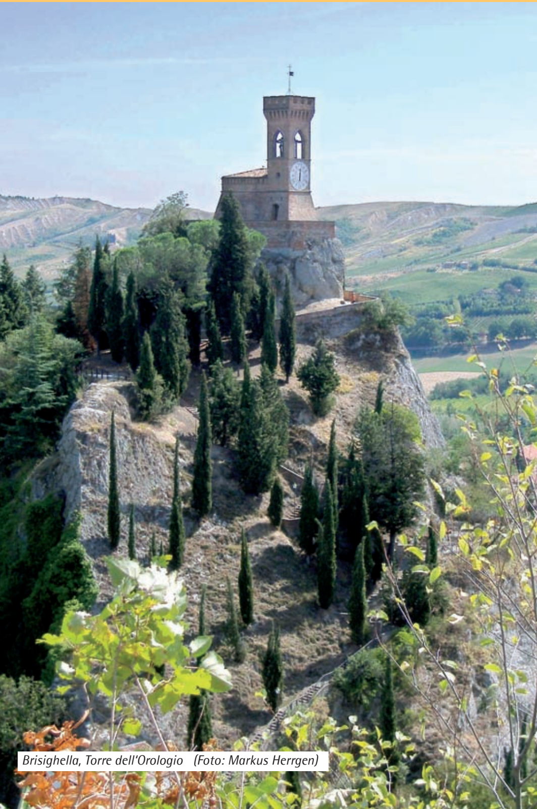
Brisighella, Torre dell'Orologio