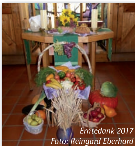
Erntedank 2017

sich die Kandidaten kurz vorstellen, und beim gemeinsamen Imbiss ist die Möglichkeit gegeben, sich mit den Kandidaten zu unterhalten, um sie besser kennenzulernen.