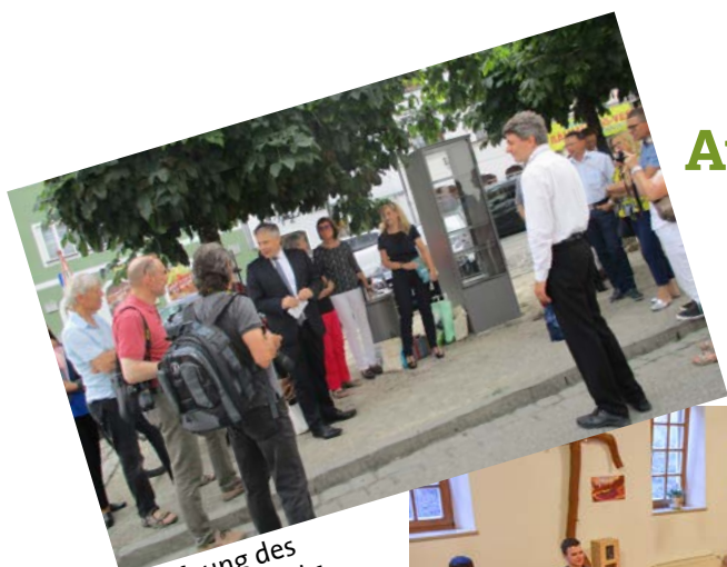
Eröffnung des Bücherschranks am 7. Juni