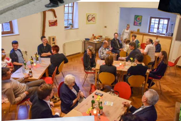
Treffen des Kirchenvorstands mit dem Pfarrgemeinderat der Pfarrei Münster - St. Moritz am 22. Juni