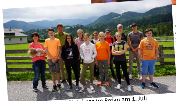
Konfi-Wanderung bei Steinberg im Rofan am 1. Juli