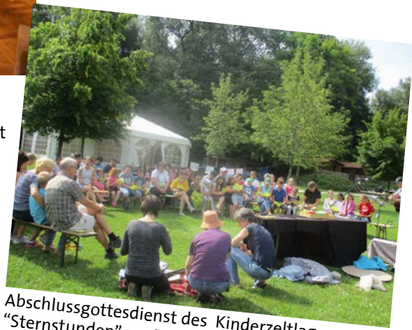
Abschlussgottesdienst des Kinderzeltlagers "Sternstunden" am Baggersee am 8. Juli