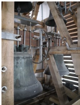
Glockenstube im Markusturm

Nächstes Jahr feiern wir das Reformationsjubiläum. Und wir feiern auch unser Mitmachfest. Da ergibt es sich, dass das Lutherjahr Auswirkungen auf unser Mitmachfest hat. Wir haben uns die ersten Gedanken hierzu gemacht und werden das in einer der nächsten Sitzungen weiter besprechen. Wir sind gespannt, was uns dazu einfällt.