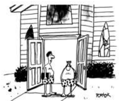
„Die beste Predigt über Opfern und Spenden, die ich je gehört habe!“

Ihre Spende ist herzlich willkommen, vielen Dank!