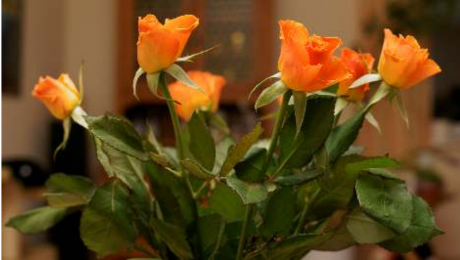
(Bilder: Oliver Stolpmann)