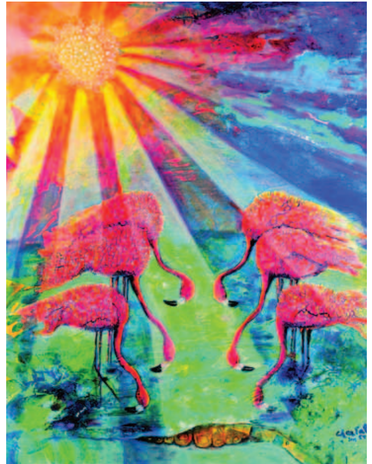
Die Ordnung für den Weltgebetstag stammt heuer von Frauen von den Bahamas