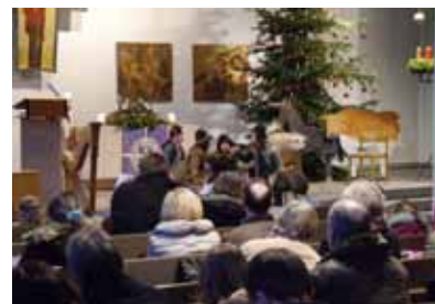
Hirten auf dem Felde