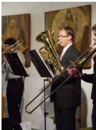
Wohlklang an allen Instrumenten