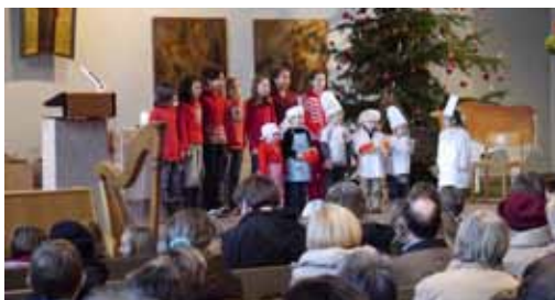
In der Kinderbäckerei ...