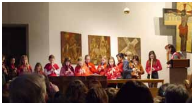
alle Flöten spielen zusammen

Im Advent durften wir uns über drei besondere Konzerte freuen. Den Anfang machte am 2ten Advent das Konzert der Chöre, dann folgte eine Woche später der Posaunenchor und am vierten Advent das Kinderkonzert. Vom Konzert der Chöre besitzen wir leider keine Bilder.