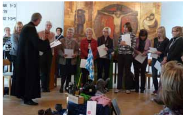
Das Büchereiteam wird geehrt