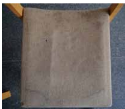
Flecken auf dem durchgesehenem Polster

Selbstverständlich erhalten alle Spender und Spenderinnen eine Quittung für das Finanzamt. Als kleines Dankeschön wollen wir auch die Namen der Spender und Spenderinnen im Internet und später auf einer Tafel in Gemeindehaus und Kirche nennen. Wenn Sie das nicht wünschen, vermerken Sie bitte „keine Nennung“ auf dem Überweisungsträger.