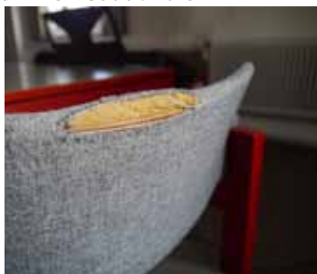
Stuhl im Sitzungszimmer mit aufgeplatzen Stoff an der Lehne

Im vergangenen Jahr hat die Markusgemeinde 50jähriges Jubiläum gefeiert. In die Jahre gekommen ist auch die Ausstattung unserer Gebäude. Besonders gelitten haben die Bankauflagen in der Kirche und die Stuhlpolster, die ca. 30 Jahre alt sind. In unzähligen Gottesdiensten, Konzerten, Seniorennachmittagen, Kirchenvorstandssitzungen und Chorproben haben sie uns gute Dienste geleistet. Im Frühjahr hatten wir das Kirchgeld für neue Bankauflagen in der Kirche erbeten. Zur Zeit prüfen wir verschiedene Angebote und wollen in Kürze neue Auflagen bestellen. Herzlichen Dank allen, die uns das ermöglicht haben.