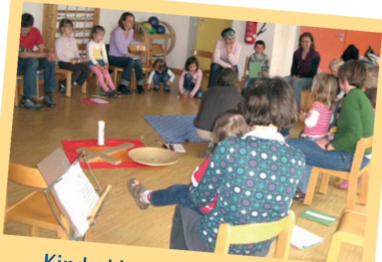
Kinderkirche in Stammham

Nachdem die Treffen von zwei Teams vorbereitet werden, ist es immer wieder überraschend und anredend, welche Ideen dabei eingebracht werden. Und es gibt viel Grund zur Dankbarkeit: für den Raum, für die Kinder und ihre Eltern, für die Mitarbeiterinnen, für die Freude am Miteinander, für den Segen Gottes. (MK)